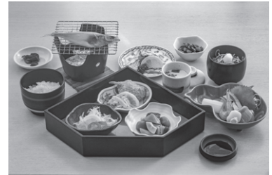
フィッシャーマンズワーフ昼食 (イメージ)

旅行代金 会員とその家族 おひとり 11,700円 非会員 おひとり 13,500円