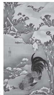
伊藤若沖《雪中雄鶏図》 江戸中期 細見美術館蔵