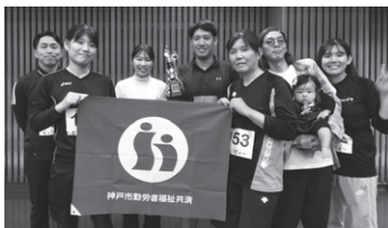
優勝 ピ♡ピ♡ （公社）日本海員救済会 神戸救済会病院