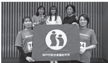
3位 TAKARA （社会福祉法人 報恩感謝会 たから保育園）