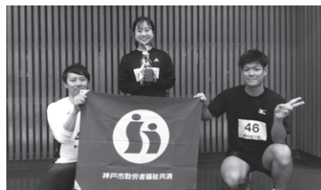
2位 あざぎり荘 （全国共済農業協同組合連合会 兵庫県本部職員親睦会）