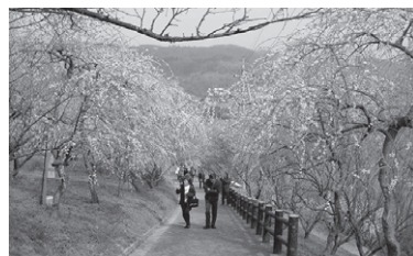
神代梅の里公園 (イメージ)

旅行代金 会員とその家族 おひとり 12,700円 非会員 おひとり 14,500円