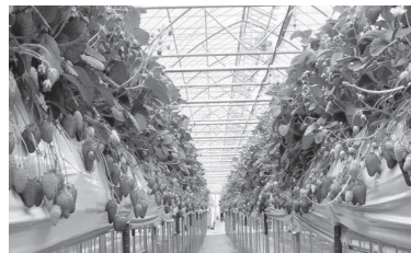
いちご狩り (イメージ)

ツアー中のマスクの着用はお客様個人のご判断に委ねることになりますが、皆様が気持ちよくご旅行をお楽しみいただけるよう、咳エチケット、継続的な会話などの際はマスクの着用など、周囲へのご配慮をお願いいたします。バス車内の換気を行い、アルコール消毒液の設置をいたします。