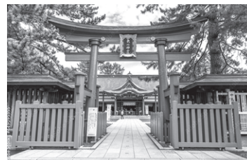
氣比神宮 (イメージ)