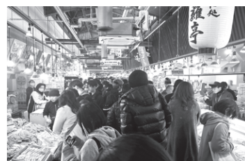
日本海さかな街 (イメージ)

旅行代金 会員とその家族 おひとり お支払金額 6,800円 (旅行代金8,800円 共済補助額2,000円) 非会員 おひとり 8,800円