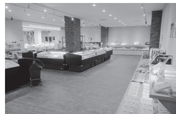
小牧かまぼこ工場 (イメージ)