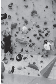
大人も頑張りました