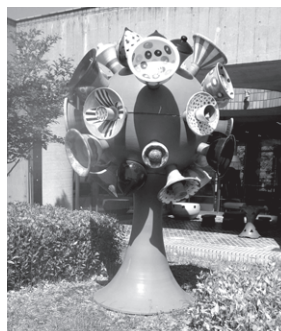
陶芸の森 (モニュメント「生命の樹」) (イメージ)

※コース内容および観光箇所が変更になる場合がございます。 ・最少催行人数に満たない場合には、旅行の実施を中止する場合がございます。この場合出発日の10日前までにご連絡いたします。 ・取消料は通常料金(非会員料金)が基準となります。